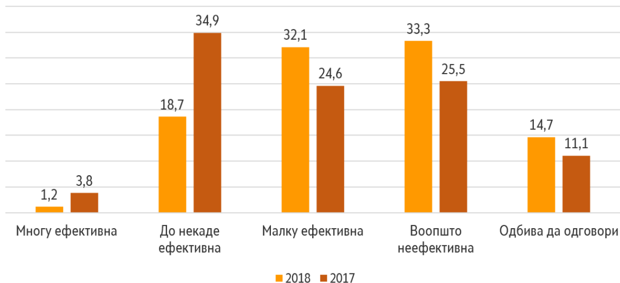
Графикон 4. Како би го оцениле работењето на ДКСК?

Запрашани да ја оценат ефективноста на ДКСК, секој трет граѓанин, односно 33,3% смета дека ДКСК воопшто не е ефективна и е зголемување во перцепцијата за неефективност споредбено со 2017 г., кога неефективноста била видена од 25,5% од граѓаните. Од друга страна, само 3,8% од граѓаните сметаат дека е многу ефективна ДКСК, додека пак половина од граѓаните или 50,8% ја оценуваат како малку и донекаде ефективна.