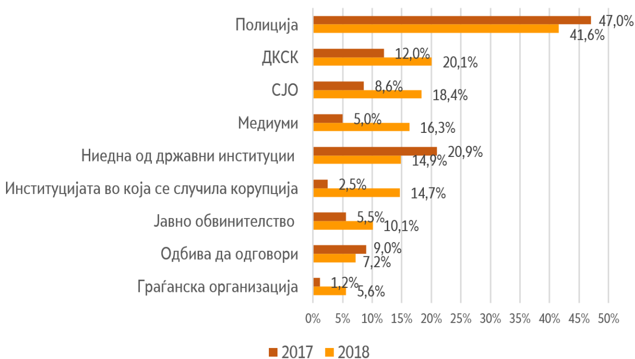
Графикон 2. Доколку се жртва на корупција, каде би ја пријавиле?

Според граѓаните, институција која најмногу придонесува во борбата против корупцијата во Македонија е Министерството за внатрешни работи. За разлика од 2017 г, кога ДКСК била на петтото место по бројот на испитаници (8%), во анкетата спроведена во 2018 г. ДКСК е препознаена како втора институција (13,1%) која најмногу придонесува во борбата против корупцијата. За разлика од над 28,7% од граѓаните кои одбиле да дадат одговор на ова прашање во 2017 г., бројот на такви испитаници во 2018 г., значително опаѓа (8%).