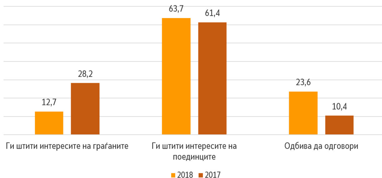
Графикон 5. Чи интереси ги штити ДКСК?

Според 72% граѓани, во медиумите нема доволно информации за ДКСК. За 77,6% граѓани информациите коишто се достапни во медиумите не им овозможуваат да се информирани за работата на ДКСК. Граѓаните многу ретко ја посетуваат веб-страницата на ДКСК. Дури 81,2% од граѓаните никогаш не ја посетиле страницата, а 11,1% ја посетиле еднаш. На редовна дневна, неделна и месечна основа, веб-страницата ја посетуваат незначителни 5,2% од граѓаните.