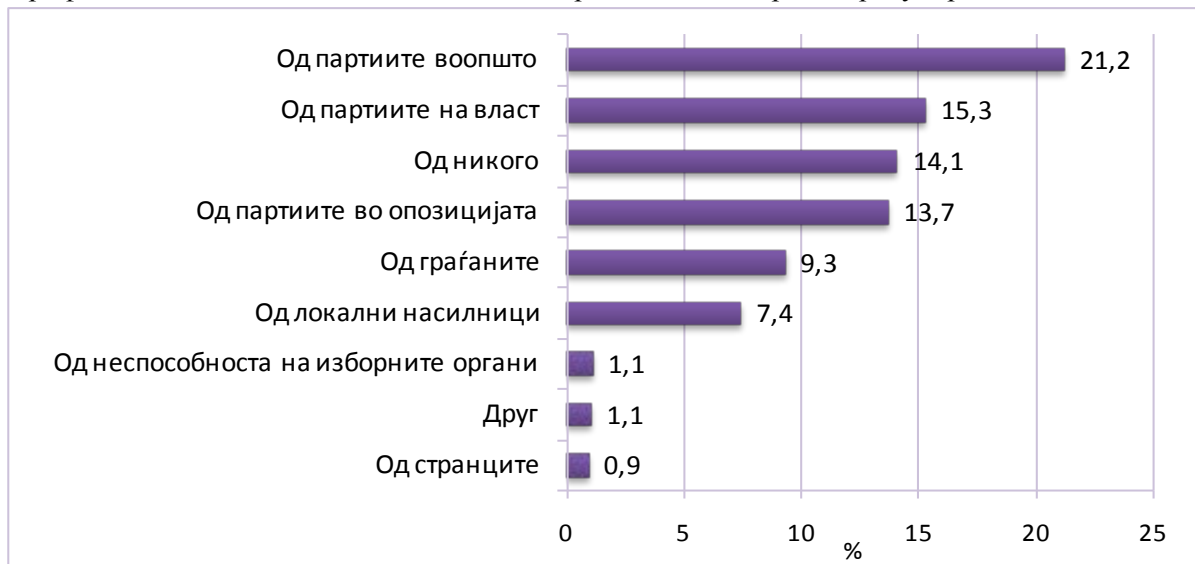
Графикон 3. Од кого се плашите дека би произлегле изборни нерегуларности?

Етничките Македонци најчесто мислат дека партиите воопшто ќе бидат причинители на нерегуларностите (23,8 %), а најмалку самите граѓани.