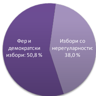
Графикон 1а. Очекувањата на граѓаните за фер и демократски избор – поедноставен приказ

Највозрасните граѓани над 65 г. најмногу стравуваат од масовни нерегуларности и насилство на изборите (17,3 %). Етничките Албанци (14,4 %) малку повеќе стравуваат од масовни нерегуларности и насилство на изборите од етничките Македонци (11,5 %), но и секој петти (18,2 %) нема одговор на ова прашање.