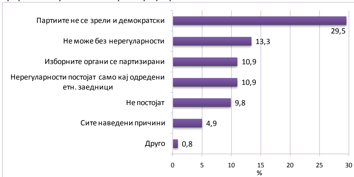
Графикон 4. Причини за изборни нерегуларности

Дека нерегуларности постојат само кај одредени етнички заедници, мислат 14,1 % од етничките Македонци и 1,8 % од етничките Албанци.