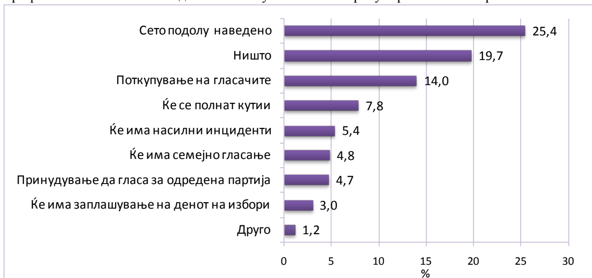
Графикон 2. Што мислите дека би се случило како нерегуларност на изборите?

Етничките Македонци мислат дека би можел да се случи поткуп на гласачи (15,4 %), а најмалку би можеле да се случат семејно гласање (3,3 %) и заплашување на денот на изборите (3,7 %).