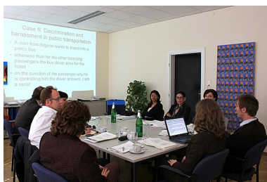
Учесниците посетија институции што работат на недискриминација

Од 20 до 22 април 2009 г., во рамките на програмата „Македонија без дискриминација“, беше организирана студиска посета во Виена, Австрија.