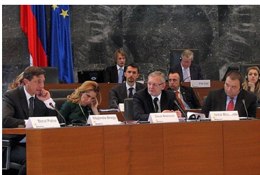
Дебатите од конгресот беа пренесувани во живо на ТВ

Амбициозниот настан насловен како Љубљана конгрес „Граѓанското општество ги предизвикува јавните авторитети“ се одржа во Љубљана во периодот 16-18 април 2009 година, во организација на Европското движење, а со поддршка на Парламентот и Владата на Словенија, Европската комисија и градот Љубљана.