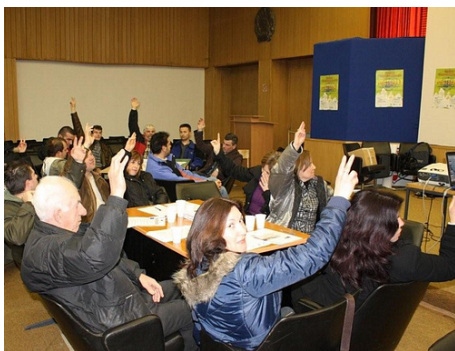
Учесниците гласаат за предлог проектите

На 24 февруари оваа година, во Ресен, се одржа четвртата форумска сесија во рамките на програмата Форуми во заедницата. На неа учествуваа 80-тина граѓани, а беа презентирани 6 концепти за проекти предложени од страна на работните групи. Присутните ги поддржаа сите предложени концепти.