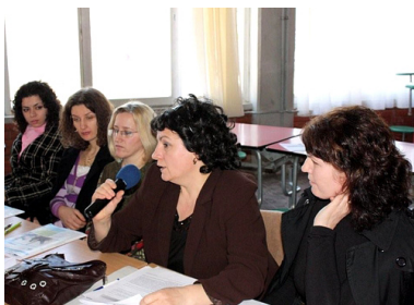
Секој коментар што ќе го подобри предлогот е добро дојден

На 28 февруари оваа година, во Битола, се одржа четвртата форумска сесија во рамките на програмата Форуми во заедницата. Пред 70-тина граѓани од Битола беа презентирани пет концепт проекти предложени од страна на работните групи.