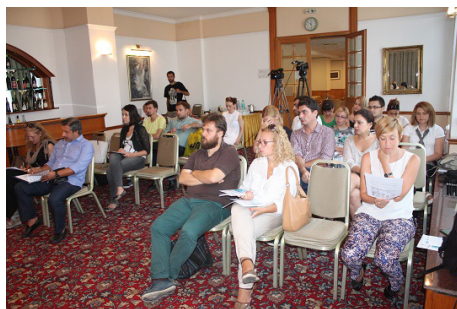
Од прес-конференцијата на двете мрежи

Тие истакнаа дека спроведувањето на договорот е императив и побараа од Владата да го објави Нацрт-акцискиот план за реализација на Итните реформски приоритети на Европската комисија, а Собранието да им овозможи на граѓанските организации да ја следат неговата работа од 1 септември до распуштањето.