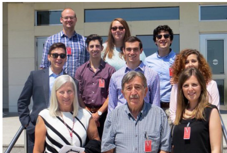
Посета на американската амбасада во Скопје