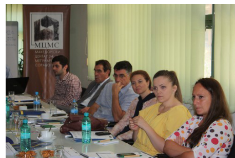
Многу предизвици пред спроведувачите: теренски и административни

разликите на побарувачката со понудата на работната сила, очекувања на корисничките и претпријатијата итн. Во поглед на администрирањето тие истакнаа дека процесот на набавки, кој се спроведува според Практичниот водич за процедури за договори на ЕУ (ПРАГ), предизвикува одложување на дел од активностите во проектите. Ова од една страна се должи на неискуството на организациите за спроведување набавки, немањето доволно или пак незаинтересирани добавувачи за одредени локации, а од друга страна на подолгиот период кој им е потребен на одговорните институции да одобрат.