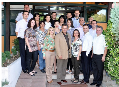
Вработените на МЦМС

МЦМС во 2010 година имаше вкупен обем (портфолио) од 18 проекти и буџет од 74 милиони денари. Реализацијата на програмското портфолио е одлична - 90 % од планот и 98 % на буџетот.