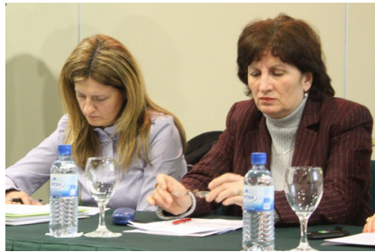
Резултатите од истражувањето беа презентирани на работилницата

од странски држави и злоупотребувани од политички партии? Мнозинството граѓани (55,9 %) сметаат дека граѓанските организации се инструмент за остварување лични цели, наспроти јавен или поширок интерес (23,8 %). Дека се организирани и финансирани од странски држави сметаат 38,8 % од граѓаните, наспроти 34,3 % кои сметаат дека се израз на граѓански интерес. Мнозинство од 51,3 % сметаат дека политичките партии ги присвојуваат нивните ставови кога им се потребни, а кога немаат интерес ги осудуваат како блиски до другите, додека за скоро секој четврти граѓанин, граѓанските организации служат како гласоговорници на политичките партии. И покрај ова, малцинство од испитаниците (31,1 %) можеле да наведат конкретна организација зад која сметаат дека стои политичка партија.