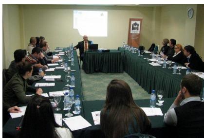
Граѓанските организации покажаа голем интерес за темата „корупција“