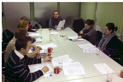
Од четиридневната обука за Раководење со проектен циклус

На 10 и 11 и на 17 и 18 јануари оваа година за ангажираните волонтери во МЦМС беше организирана Обука за раководење со проектен циклус. На обуката учествуваа и вработени на МЦМС кои досега немале можност да ја посетат.