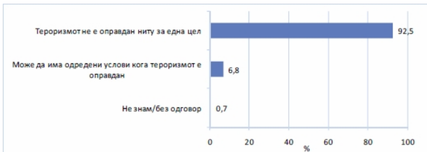
Графикон 1. Ставови на граѓаните за оправданост на тероризмот

Големо мнозинство граѓани (92,5 %) не го оправдуваат тероризмот за ниту една цел. Не постојат разлики по социо-демографска основа.