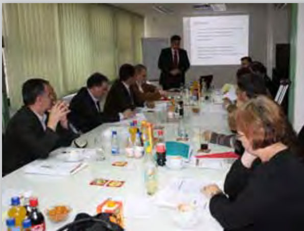
Foto. 16 Një nga mbledhjet e Këshilli të MCMS