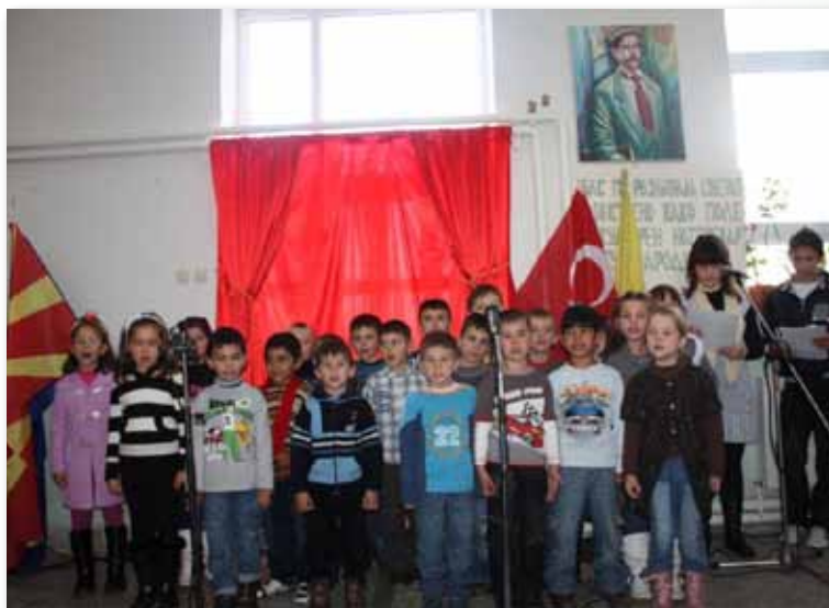
Foto. 1 Nga programi i përgatitur nga arsimtarët dhe fëmijët për mysafirët e tyre

Mysafirët, ministri i Arsimit dhe Shkencës, Nikolla Todorov, përfaqësuesit e donatorëve të MCMS dhe TIKS dhe kryetari