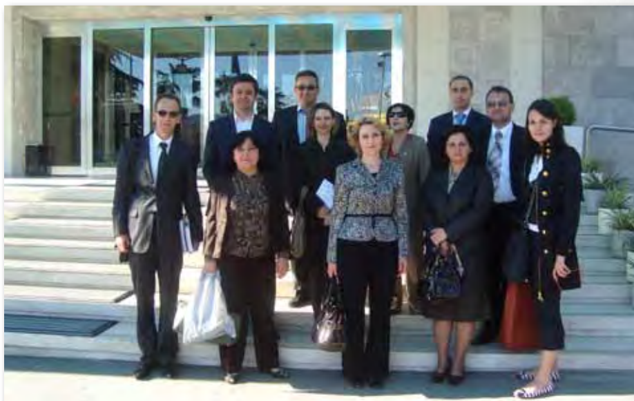
Foto. 9 Pjesëmarrësit gjatë vizitës së studimit në Bullgari

Institucionet relevante shtetërore dhe organizatat qytetare, pjesëmarrësve ua prezantuan rregulloren juridike dhe përvojat gjatë implementimit të buxhetimit participativ në nivel nacional dhe lokal. Pjesëmarrësit e vizituan Shoqatën e komunave të Shqipërisë, Parlamentin, ndërsa patën takime edhe me përfaqësues të Komisionit parlamentar për ekonomi dhe financa. Në Ministrinë e Financave iu prezantua procesi i përgatitjes së buxhetit dhe qasja e tyre drejt procesit programor buxhetor. Një pjesë e praktikave të mira ishin në sektorin qytetar. Pjesëmarrësit e vizituan Institutin për