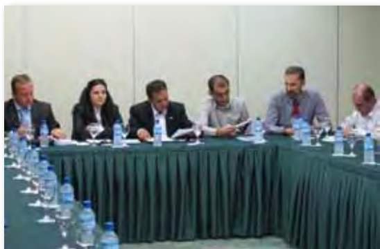
Foto. 14 Një nga takimet e Trupit koordinues nacional

Në vitin 2010, anëtarët e Lidhjes “Maqedonia pa diskriminim” punuan në mënyrë intensive në përgatitjen dhe lobimin për Ligjin për pengimin dhe mbrojtjen nga diskriminimi.