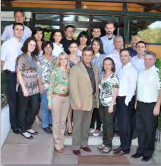
Foto. 17 Të punësuarit në MCMS