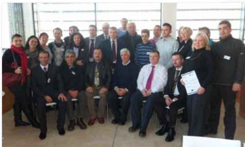
Foto. 5 Pjesëmarrësit dhe nikoqirët gjatë vizitës së studimit në Omag, Irlandë Veriore