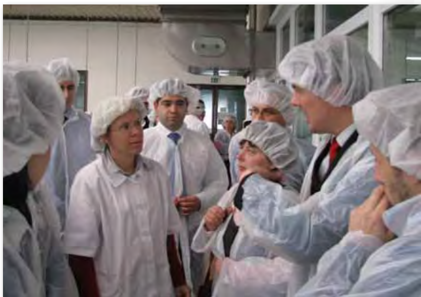
Foto. 4 Nga vizita qumështores Celepa gjatë vizitës së studimit në Slloveni

U realizua vizitë studimi në Slloveni për IPARD për përfaqësuesit e institucioneve financiare, ndërsa u siguria edhe mbështetje financiare për përpunimin e softuerit për vlerësimin e mikro kredive.