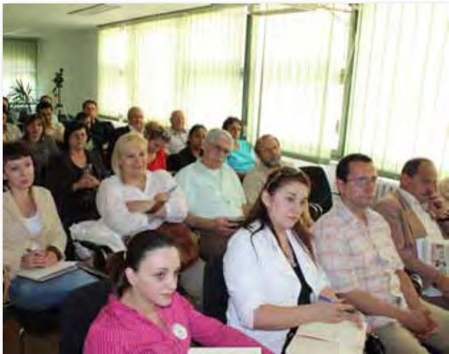
Foto. 11 Nga ngjarja informative për LSHF në Shkup

Me qëllim të informimit më të madh të organizatave qytetare për ligjin e ri dhe risitë, në maj dhe qershor 2010 u organizuan pesë ngjarje informative për LSHF në Manastir, Gostivar, Veles dhe Shkup, ku morën pjesë 98 përfaqësues nga organizatat qytetare.