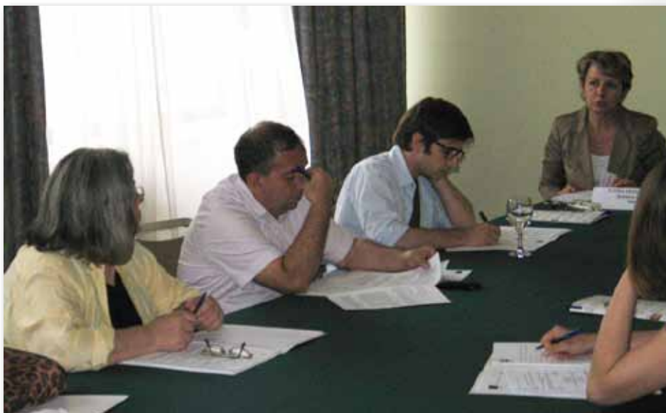
Foto. 3 Lidhja MPD ishte shumë aktive në procesin e formulimit dhe miratimit të Ligjit

U miratua Ligji për pengimin dhe mbrojtjen nga diskriminimi. MCMS mori pjesë aktive në mbledhjet e komisioneve kuvendore, ku u diskutua Ligji i propozuar për pengimin dhe mbrojtjen nga diskriminimi (LPMD) dhe në kuadër të Lidhjes Maqedonia pa diskriminim, propozoi 33 amendamente, nga të cilat gjysma u pranuan. Pas miratimit të LPMD u organizuan edhe punëtori të Trupit nacional koordinues për jo diskriminim, ku u diskutua për formimin e Komisionit për mbrojtje nga diskriminimi. U organizua edhe punëtorja “Sfidat për zbatimin e Ligjit për pengimin dhe mbrojtjen nga diskriminimi”.