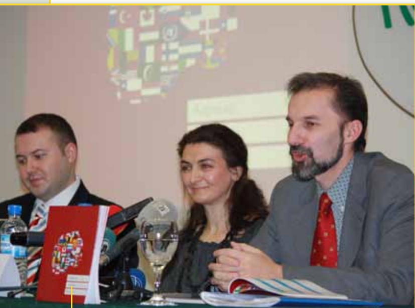
Adresari do të jetë vegël e dobishme për komunikim ndër mërgimtarët

Adresari ka për qëllim ta përmirësojë informimin për organizatat e mërgimtarëve nga Maqedonia, si mes tyre, ashtu edhe të opinionit të gjerë në Maqedonisë. Ai përmbledh informata për 584 organizata, nga gjithsej 25 vende.