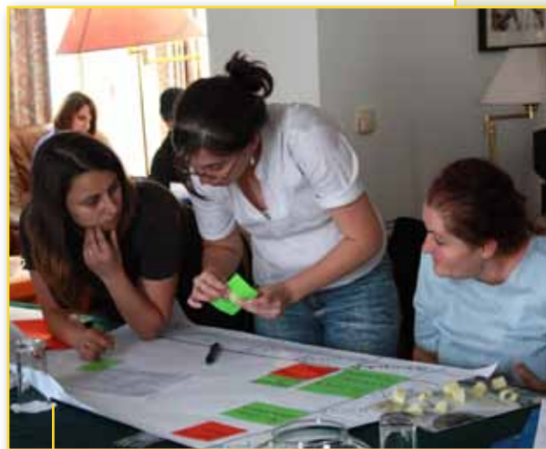
Një pjesë e pjesëmarrësve në njërin nga ushtrimet praktike gjatë trajnimit

Si pjesë e kursit për avokim dhe lobim pjesëmarrësit morën kaluan nëpër identifikimin e çështjes ose problemit për të cilin do të avokohet ose lobohet, nëpër qëllimet, partneritetet dhe aleancat që do të bëhen, përmes ballafaqimit me fuqinë, më tej biseduan për inkuadrimin në krijimin e politikave, vetë krijimin e politikave dhe në fund vetë analizuan policy paper të përgatitura.