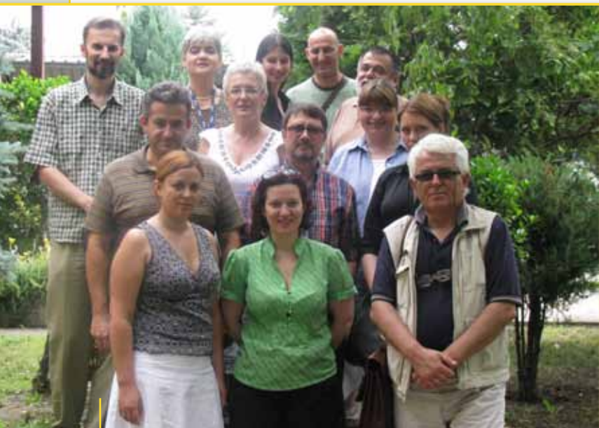
Pjesëmarrësit e Kuvendit themelues të Rrjetit Ballkanik për Zhvillimin e Shoqërisë Civile

Rrjeti Ballkanik për Zhvillimin e Shoqërisë Civile (BCSDN) pas tetë vitesh, kur filloi si pilot projekt dhe pesë vite funksionim si rrejt, më 1 tetor 2009 u regjistrua si subjekt juridik. Në muajin korrik u mbajt kuvendi themelor ku u miratua Statuti dhe Orientimi strategjik 2009-2011 dhe u zgjidh Këshilli, Bordi dhe Drejtori ekzekutiv.