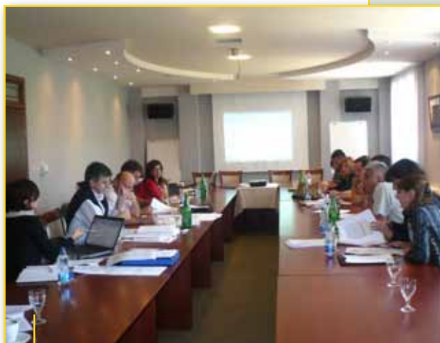
Në një nga mbledhjet e grupit punues që punoi në testin e propozim Ligjit

Grupi punues mbajti gjashtë takime. Në këtë periudhë u mbajtën edhe disa mbledhje koordinative bilaterale me Fondacionin Instituti Shoqëria e Hapur Maqedoni (FISHHM), Qendrën Evropiane për të Drejtë Jofitimprurëse (ECNL) dhe Ministrinë e Drejtësisë.