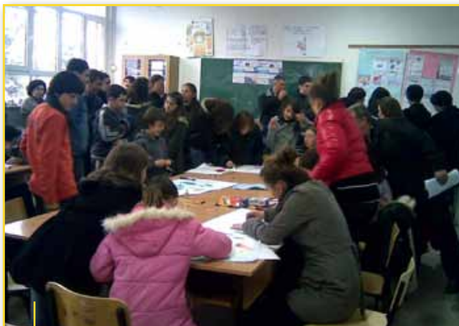
Orët edukative u vizituan masovikisht dhe u pranuan me enuziazëm të madh

Në fund të ngjarjes të gjithë fëmijëve iu ndanë dhurata.