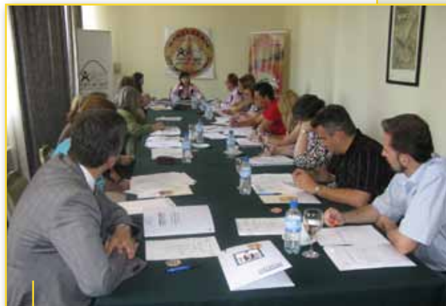
Nga themelimi i Kuvendit të Aleancës MBD

Themelues të Aleancës janë: Asociacioni për iniciativa demokratike nga Gostivari, El Hilal nga Shkupi, Qendra maqedonase për të drejta të grave nga Shkupi – Shelter qendra nga Shkupi, Qendra Maqedonase për Bashkëpunim Ndërkombëtar nga Shkupi, Këshilli nacional i grave të Maqedonisë nga Shkupi – LOGM nga Shkupi, Polio plus-lëvizja kundër handikapit nga Shkupi, Ambasada e parë e fëmijëve në botë Megjashi nga Shkupi, Shoqata bamirëse dhe humanitare e romëve “Meseçina” nga Gostivari, HOPS – opsione për jetë të shëndoshë nga Shkupi, Qendra për të drejta të njeriut dhe zgjidhjen e konflikteve nga Shkupi dhe “Universiteti” Moshë e tretë nga Shkupi.