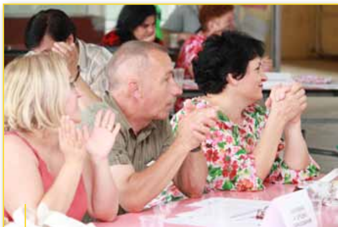
Qytetarët e Manastirit e përshëndetën zgjedhjen e projekteve prioritare që do të financohen me mjete nga programi

Në vitin 2009, u mbajtën 5 sesione të forumeve në resoje dhe 5 në Manstir. Banorët