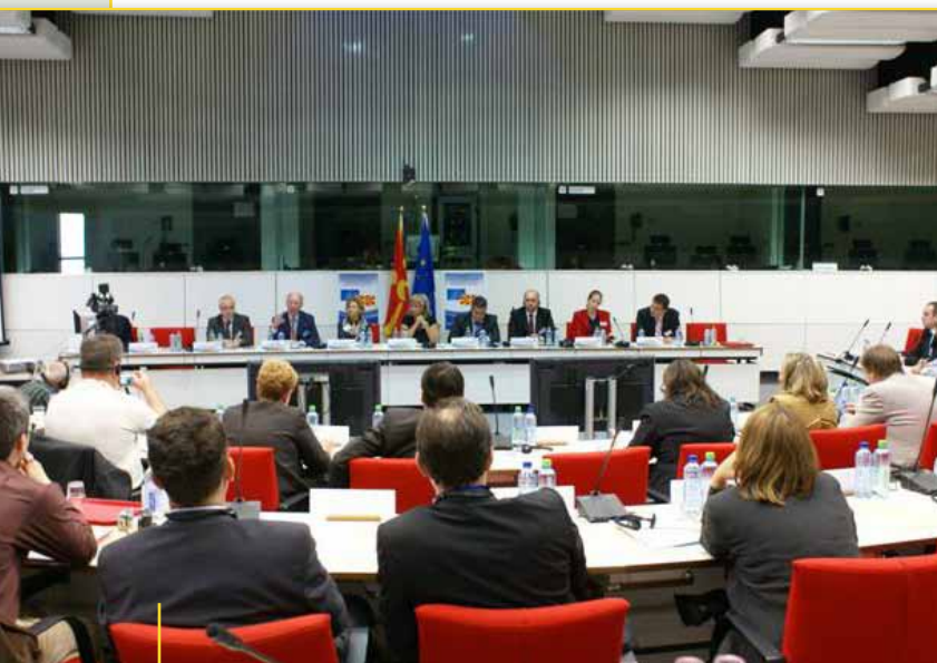
Nga mbledhja inauguruese e KPK në Bruksel

Më 25 shtator 2009, Komiteti ekonomik dhe social evropian (KESE) ishte nikoqir i Komitetit të parë të përbashkët konsultativ (KPK) i shoqërisë civile të BE dhe Republikës së Maqedonisë. KPK është trup i përbashkët konsultativ që ka për qëllim ti vëzhgojë marrëdhëniet mes BE dhe Republikës së Maqedonisë nga pikëpamja e shoqërisë civile. KPK do ti promovojë kontaktet dhe diskutimin mes përfaqësuesve të shoqërisë civile nga të dy anët për çështjet me interes të përbashkët.