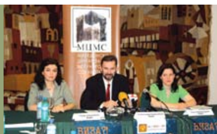
Fillimi i vëzhgimit të lehtësimit të vizave u paralajmërua me pres konferencë

Ky është rrëfimi i një çifti nga Kumanova i cili planifikonte ta vizitonte djalin, vajtën dhe mbesën e tyre në Gjermani. Ata parashtruan kërkesë për vizë më 19 shkurt. Letra garantuese ka qenë e siguruar nga fëmijët e tyre që punojnë dhe jetojnë në Gjermani me vite të tëra. Personi ka sqaruar se është i punësuar dhe është në mundësi të sigurojë dëshmi për këtë për nevojat e ambasadës. Kërkesa e tyre për vizë është mbajtur shtatë ditë dhe janë informuar se janë refuzuar. Edhe krahas kërkesës për sqarim për shkaqet e refuzimit, nuk u janë dhënë informata dhe janë larguar me fjalët: “ky udhëtim është i panevojshëm dhe çfarë kërkon atje”. Bashkëshorti për herë të dytë parashtron kërkesë për vizë, dhe pasi që nuk merr sqarim pse është refuzuar është demoralizuar që të aplikojë përsëri.