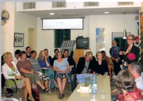
Takim në Swedish Christian Study Center me përfaqësuesit e organizatës Breaking the silence, Rabbies For Peace dhe B'etsleem.

Organizata angazhohet që ta njoftojë opinionin izraelit mes shkrimeve dhe botimin e dëshmive të ish luftëtarëve izraelit për veprimet e tyre në terrioret e okupuara. Edhe pse territori i okupuar është vetëm 10 minuta larg Jerusalemit, popullata izraelite nuk shkon atje dhe nuk e di si është gjendja.