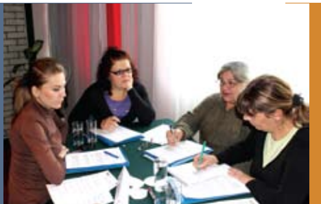
Pjesëmarrësit në grupe i përpunojnë rastet e diskriminimit