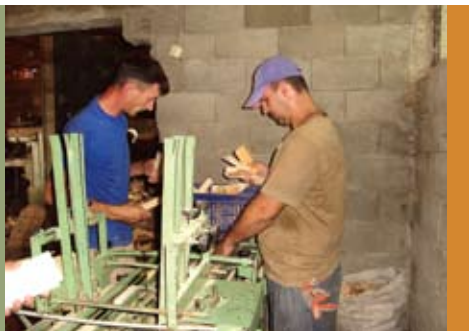
Punishtja e dërrasave në Bosillovë e mbështetur nga linja kreditore e MRFP

MRFP kremtoi 10 vjet nga ekzistimi i saj. U organizua kremtim ku morën pjesë donatorë, bashkëpunëtorë, partnerë dhe përfaqësues të sektorit afarist dhe atij shtetëror dhe ku u prezantuan arritjet, si dhe planet e ardhshme të MRFP. Për këtë qëllim u publikua edhe monografia me titull "10 vjet MRFP" .