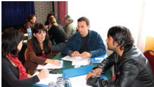
Përmes ushtrimeve, pjesëmarrësit testojnë si do të dukej aplikimi konkret i Ligjit