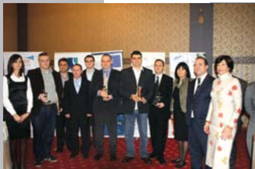
MRFP ishte një ndër organizuesit e "Sipërmarrës i vitit"