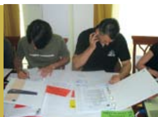
Disa nga pjesëmarrësit në fund të trajnimit kishin plan se si do ti aplikojnë njohuritë