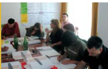
Përveç teorisë, pjesëmarrësit edhe praktikisht i aplikuan veglat për planifikim strategjik

Edhe pse gjithë trajnimin e konsiderojnë si të dobishëm, më së shumti i veçuan SWOT analizën dhe SOR matricën, pastaj drurin e problemeve dhe kornizën logjike. Pjesëmarrësit vlerësuan se qëllimet e trajnimit u plotësuan, ndërsa për vetë trajnimin thanë se është shumë i dobishëm. Ata që ishin më aktiv në fund të trajnimit kishin plan se si do ti aplikojnë njohuritë e fituara.