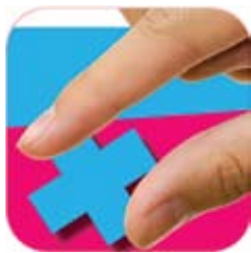
Logoja nën të cilën u realizua fushata "Dhuro nga tatimi yt"

MCMS këtë vit e realizoi projektin "Promovimi i nxitjeve tatimore për personat fizik", ku përmes fushatës mediave në gazetat ditore dhe javore qytetarët u informuan për mundësinë që të dhurojnë një pjesë të tatimit të ardhurave të tyre personale për projekte të organizatave qytetare.