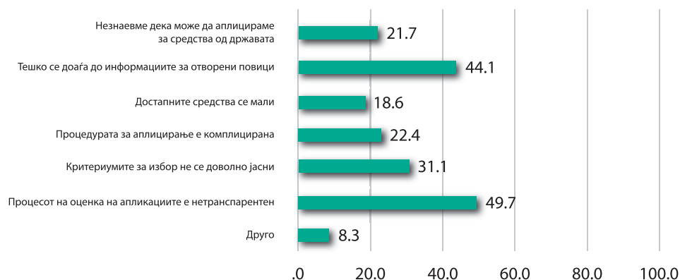
Графикон 2. Причини зошто ГО не аплицираат на повици

Други причини кои организациите ги наведуваат се партизираност на процесот на доделување средства и следење лични интереси (3), демотивираност за аплицирање заради отсуството на вклученост во донесување одлуки и креирање политики, отсуство на поддршка за новоформирани организации (2), отсуство на доверба (4) поради одбивање без образложение