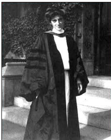
Софонсиба Престон Брекинриц