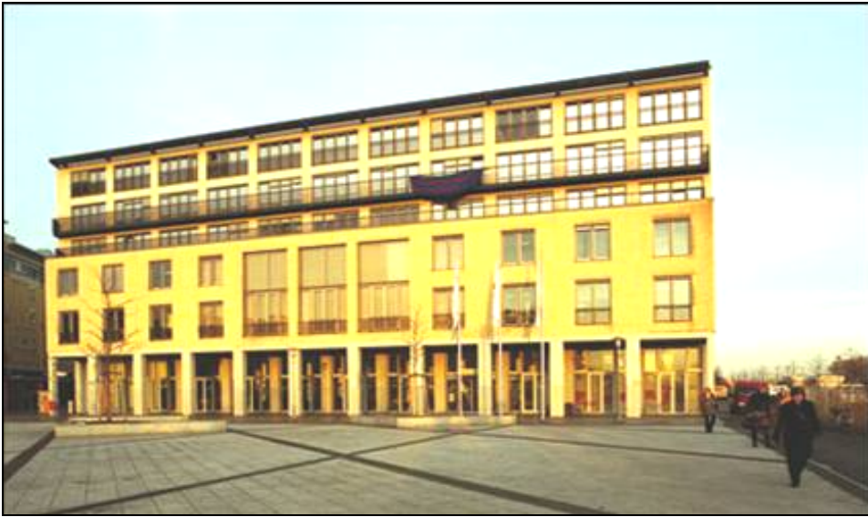
Факултетот Алис Саломон

меѓу теоријата и праксата и меѓународната ориентација поставени уште од првото женско школо за социјална работа, остануваат најзначајни принципи на тој тренинг и до ден денес. Архивата Алис Саломон била отворена во 2001 година, а тогаш била доделена и првата награда Алис Саломон.