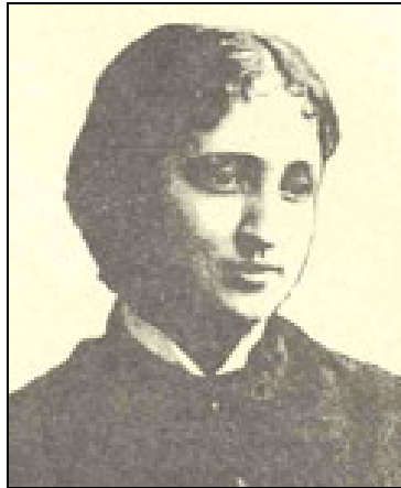
Мери Елен Ричмонд ◀ ◀ ◀ ◀

Пионерката во професионалната социјална работа и учесничката во интегралниот дел на женската историја на САД, Мери Елен Ричмонд, работела со семејства и нивните социјални проблеми, а нејзините истражувања дале значаен придонес во трансформацијата на добротворната, во професионална социјална работа. Таа го креирала моделот на социјална работа со поединец.