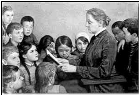
Џејн Адамс во едукација на младите

Со текот на времето Адамс изградила мост меѓу имигрантите и староседелците, меѓу аматерските реформатори и професионалните политичари, дури и меѓу приватната филантропија и владата. Таа го издигнала Хул хаус на ниво на Завод за секаков вид социјална служба, на ниво на експериментална лабораторија за социјални реформи, на дом за уметност, музика, драма и едукација, на ниво на школа за граѓанство и на ниво на универзитет за социјална служба.