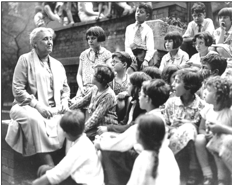
Адамс понудила продолжено учење за младите