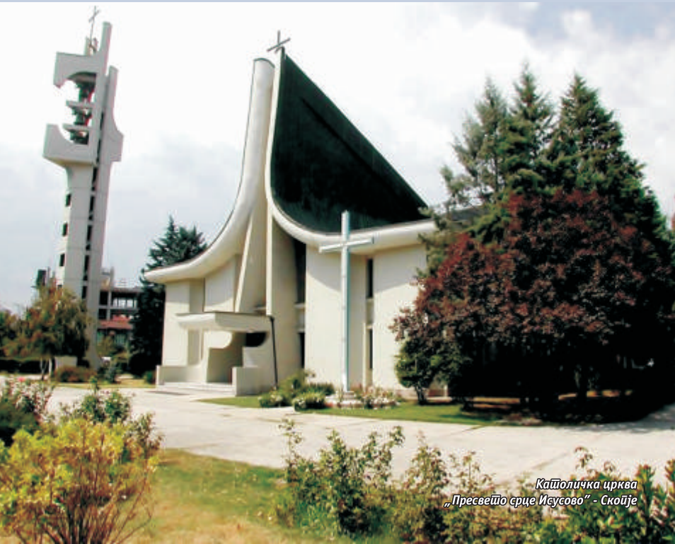
Католичка црква „Пресвето срце Исусово“ - Скопје

Онѝ кои се надеваат на Госјода, ќе ја обноват силата своја: ќе кренат крилја како орли, ќе ширчат и нема да им биде тешко, ќе одаат и нема да се уморат (Исаја 40,31).