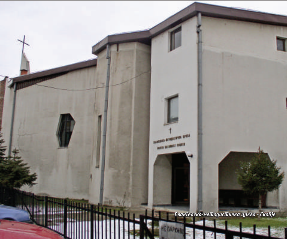
Евангелско-методистичка црква - Скопје

Не оџкажувај да му најправиш добро на оној кој има потреба, кога раката твоја има сила да му помогне Соломонови изреки. 3,27