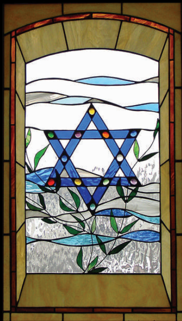
Внатрешност од Синајташа „ВЕТН УААКОВ“ - БЕТ ЈАКОВ во Скопје

Зборови на пророкот Исаија: Камо среќа да се исполнат зборовите на пророкот Исаија, народите да ги прековаат мечовите во ѓлужови, којјаша во српови, никогаш повеќе народ против народ меч да не крене, никогаш повеќе војни да не бидат Амен