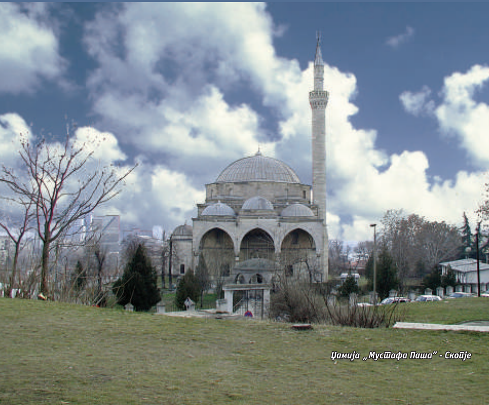
Џамија „Мусџафа Паша“ - Скопје