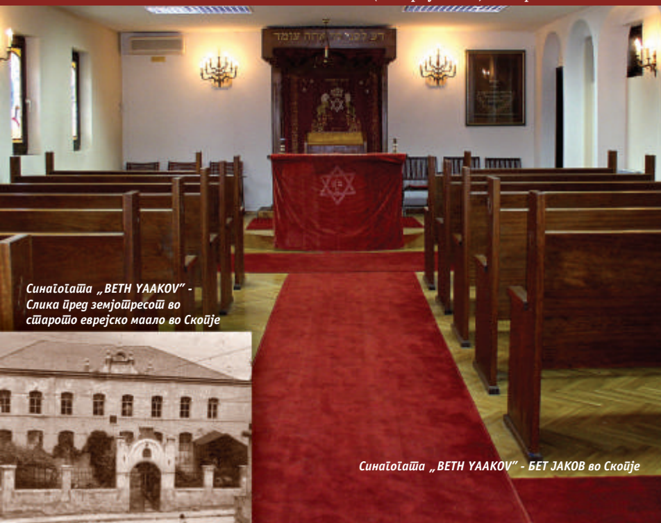
Синагогата „BETH YAakov“ - Слика пред земјотресот во старото еврејско маало во Скопје

Рабан Шимон Бен Гамлиел ѓовореше: На три работи светиот оштојува: На правда, на вистина и на мир, како што е речено: Зборувајте вистина еден на друг, праведно и мирољубиво судејте три дортиите ваши. (Захарија 8 : 16) / Пирке Авот 1 : 15 /