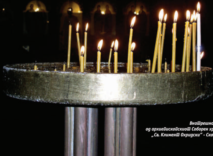
Внатрешност од архиепископскиот Соборен храм „Св. Климент Охридски“ - Скопје

Ако е можно, доколку што зависи од вас, бидете во мир со сите луѓе (Рим. 12,18).