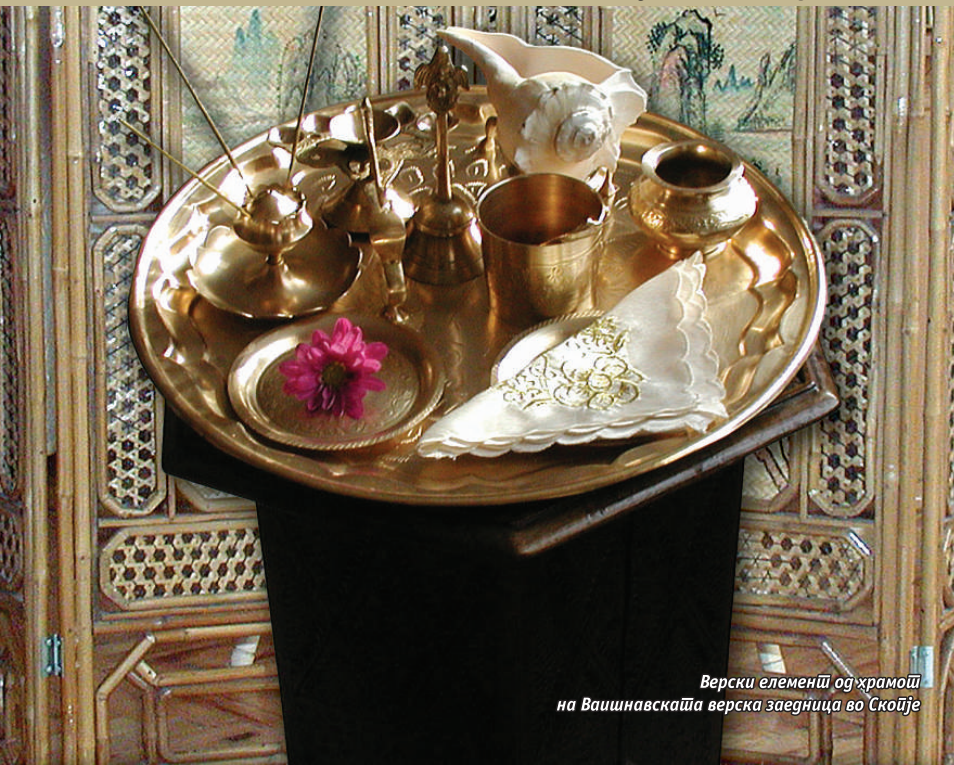
Верски елементи од храмоџи на Ваџшнавакџаџа верска заедница во Скопје

За оној шито го овладеал умоџи, умоџи е најголем ѝријател, но за оној шито не го стџорил шџоа, умоџи ќе остџане најголем неѝријател (Бхаџаваг-Гџџа 6.6 / Bhagavat-Gita 6.6).