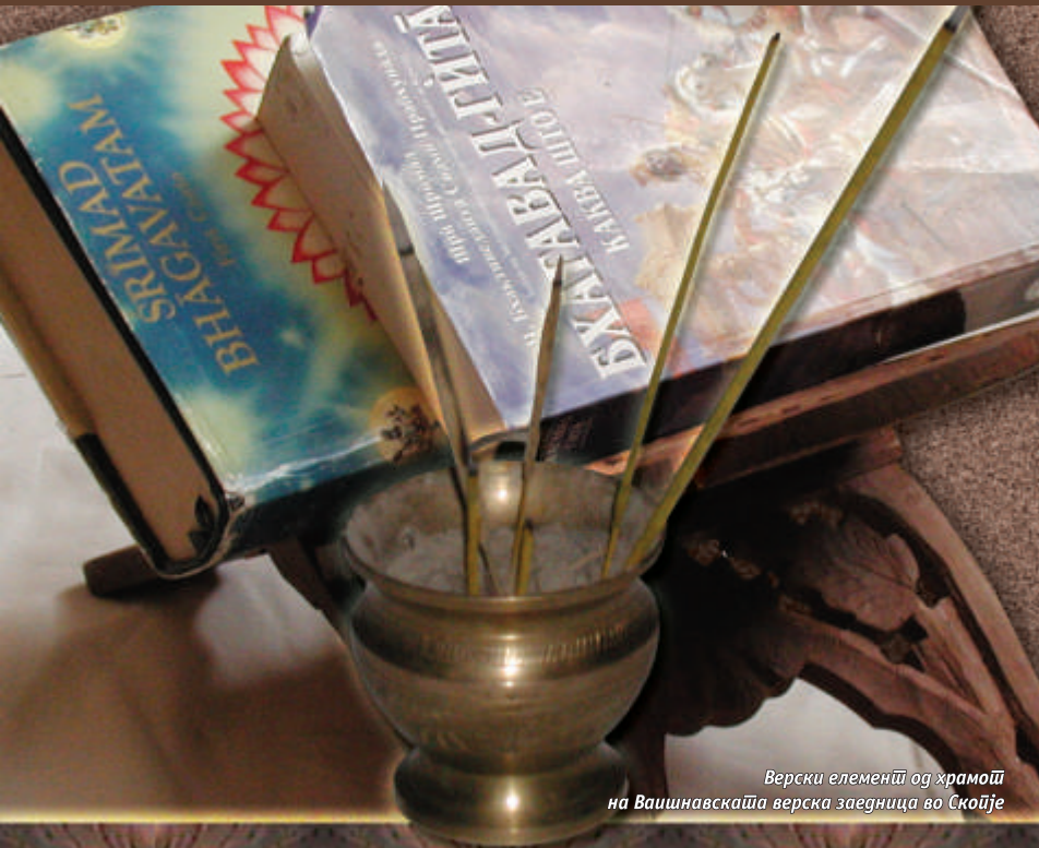
Верски елемент од храмот на Вашнавската верска заедница во Скопје

Оној што не е поврзан со Севиниоти не може да има ни трансцендентална интелекција ниту постојан ум, без кои не може да најде мир. А како може да постои среќа без мир? (Бахаваји-Гита 2.66 / Bhagavat Gita 2.66)