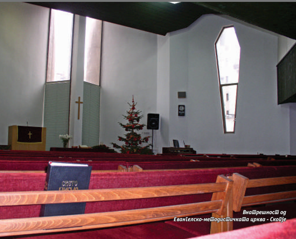
Внаџреиниџи од Еванџелско-метоџистиџкаџа црква - Скопје

Милостинаџа и вераџа да не бидат скудни во тебе: Обеси џи на враџаџа свој, најини џи на џлочиџе на срцеџа свое Соломонови изреки 3,3