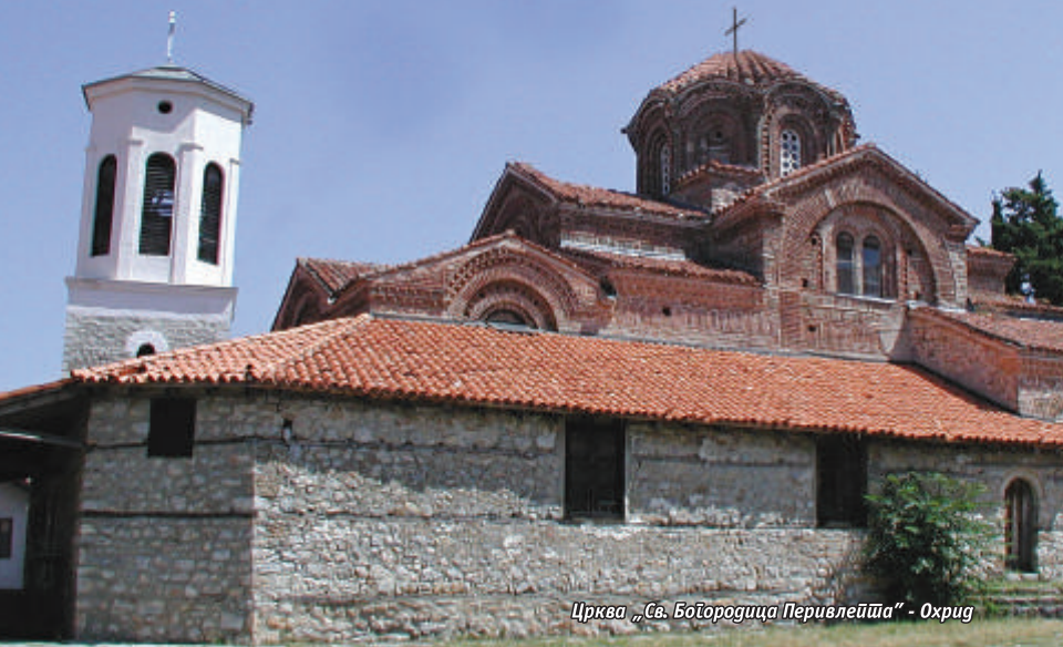
Црква „Св. Богородица Перивлејшa“ - Охрид